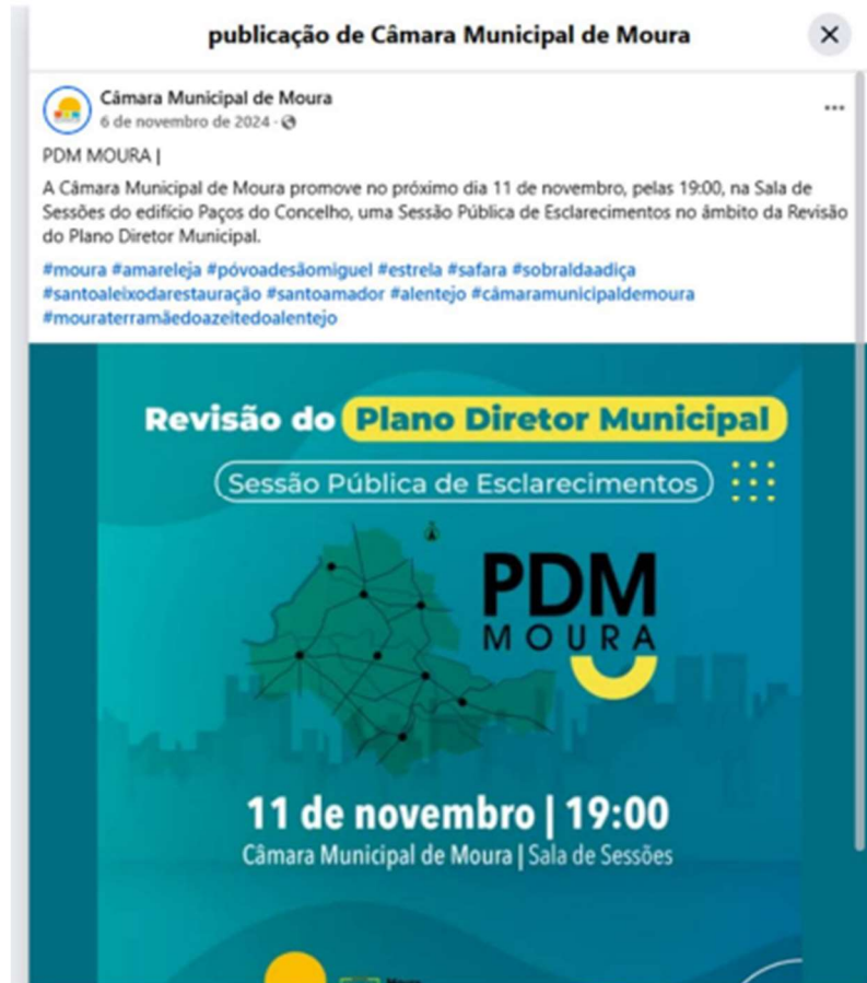
Figura 3.2. Cartaz de divulgação da sessão pública de apresentação da proposta de revisão do PDM