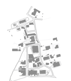
Edificado e rede viária

plano: Alteração do Plano de Pormenor da Zona de Atividades Económicas de Moura (PPZAE) Fase 2 - Proposta de Plano