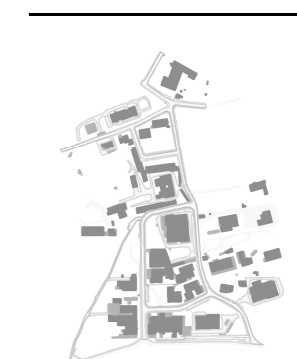
Edificado e rede viária

plano Alteração do Plano de Pormenor da Zona de Atividades Económicas de Moura (PPZaEM) Fase 2 - Proposta de Plano