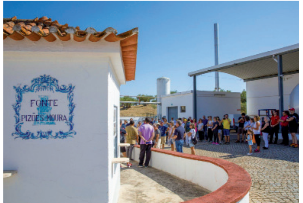
// Nascente de Pisões

A sessão de assinatura do protocolo decorrerá no recinto do Castelo de Moura, local da primeira unidade de exploração, pelas 14:30, do dia 14 de janeiro, sendo posteriormente realizado o Percorso Temático da Água “Do Castello até Pisões”.