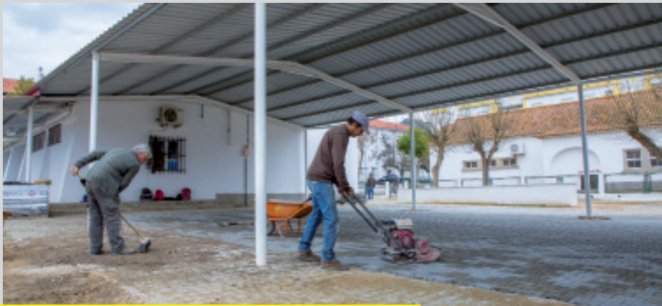
// Trabalhos de pavimentação na EB1 / JI do Fojo

Aproveitando o período de interrupção letiva do Natal, a Câmara Municipal de Moura deu início no passado dia 20 de dezembro aos trabalhos de pavimentação, com pavês de cimento, do espaço sob o alpendre da Escola Básica do 1.º Ciclo com Jardim de Infância do Fojo.